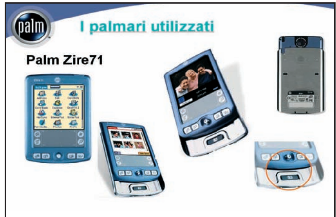
I palmari utilizzati: Palm Zire71 con fotocamera digitale.

dati contenuti venivano immessi manualmente nel sistema centrale. In alternativa, le informazioni venivano direttamente comunicate per telefono. Grazie ai nuovi strumenti invece, è garantita la sincronizzazione costante dei dati con il sistema centrale: i promotori comunicano i propri rilevamenti alla sede in tempo reale e ricevono a loro volta i dati più aggiornati. Fra i numerosi ed evidenti benefici della nuova procedura, vi è innanzitutto la possibilità di guadagnare un giorno intero su tutti i processi, e inoltre, la rilevazione dei dati è più rapida e praticamente priva di errori. I dati arrivano direttamente alla sede centrale senza