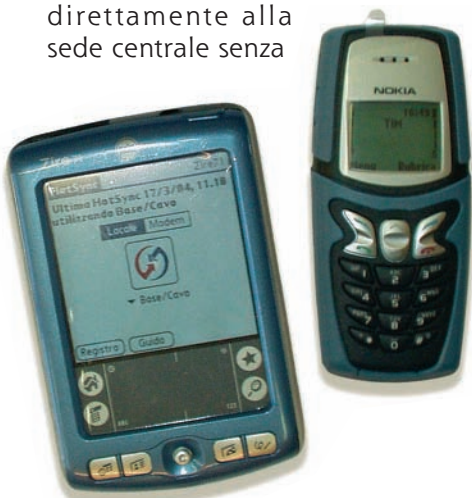
La comunicazione dei dati dal palmare avviene mediante connessione GPRS stabilita dal telefono cellulare. Palmare e cellulare comunicano mediante porta a infrarossi.